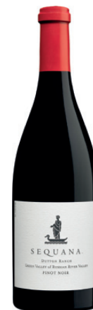
DUTTON PINOT NOIR Producent: Hess Szczep: Pinot Noir Cena: 190 zł Dystrybutor: www.sommelier.com.pl