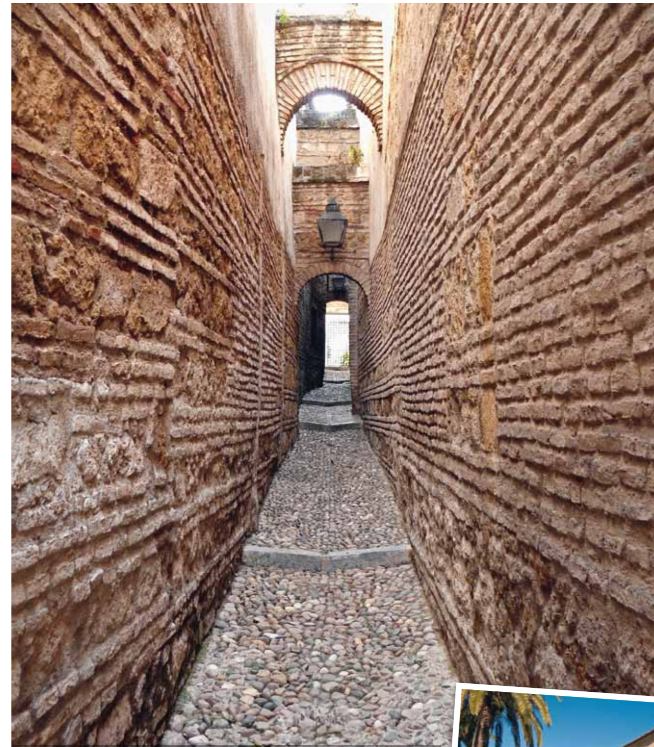
Kordoba, miasto w Andaluzji. Do XV w. miejsce zamieszkania tysięcy Żydów. Na zdjęciu mała uliczka w byłej dzielnicy żydowskiej, dziś włączonej w obręb Starego Miasta