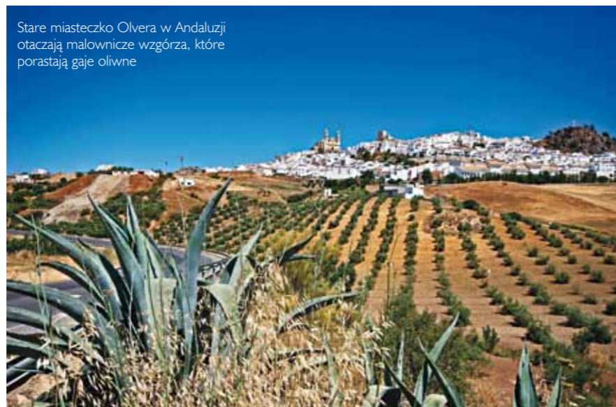
Stare miasteczko Olvera w Andaluzji otaczają malownicze wzgórza, które porastają gaje oliwne