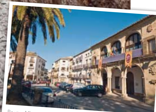
Baeza. Miasto pełne renesansowych zabytków. Jest siedzibą uniwersytetu i turystyczną atrakcją Andaluzji

W Baeza polecam hotele Puerta de la Luna i Palacio de los Salcedo, urządzone we wspaniałych XVII-wiecznych pałacach, a w Ubędzie niedrogo (dla noclegu ok. 50 euro) i wygodnie ulokowane Alva i Fanez oraz Husa Rosaleda de Don Pedro.