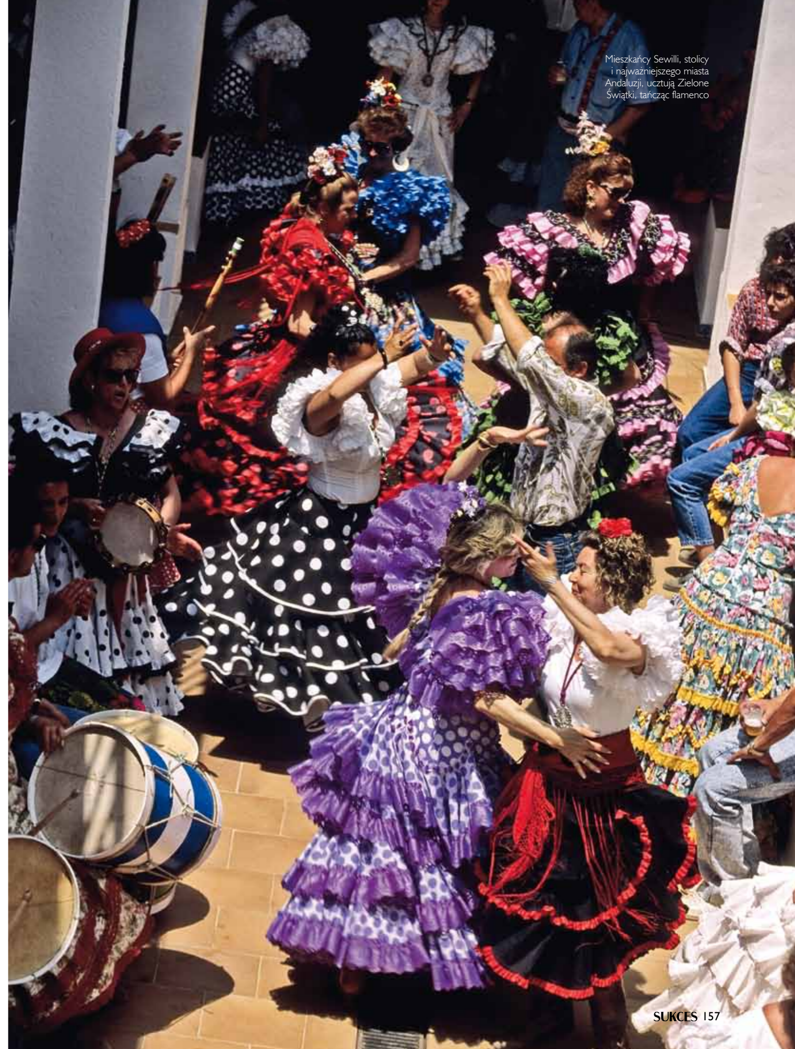
Mieszkańcy Sewilli, stolicy i najważniejszego miasta Andaluzji, uczują Zielone Świątki, tańcząc flamenco