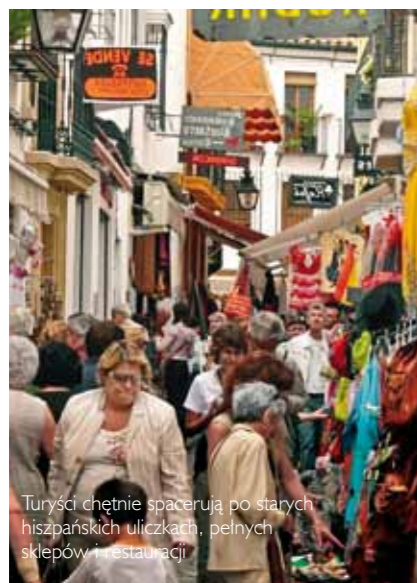
Turyści chętnie spacerują po starych hiszpańskich uliczkach, pełnych sklepów i restauracji