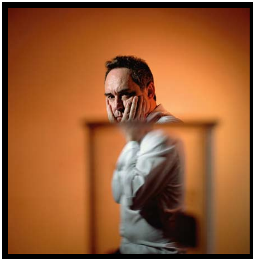
Ferran Adrià uczestniczył w jednym z najważniejszych wydarzeń sztuki współczesnej – wystawie Documenta w Kassel w 2007 r. „Gotowanie może być sztuką”, tłumaczył jego udział kurator.